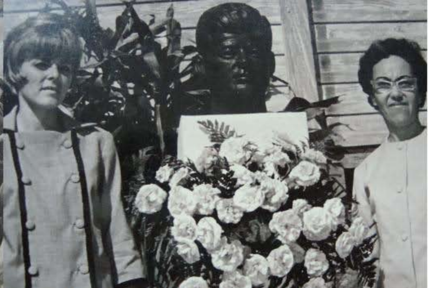
E. E. PRESIDENTE KENNEDY