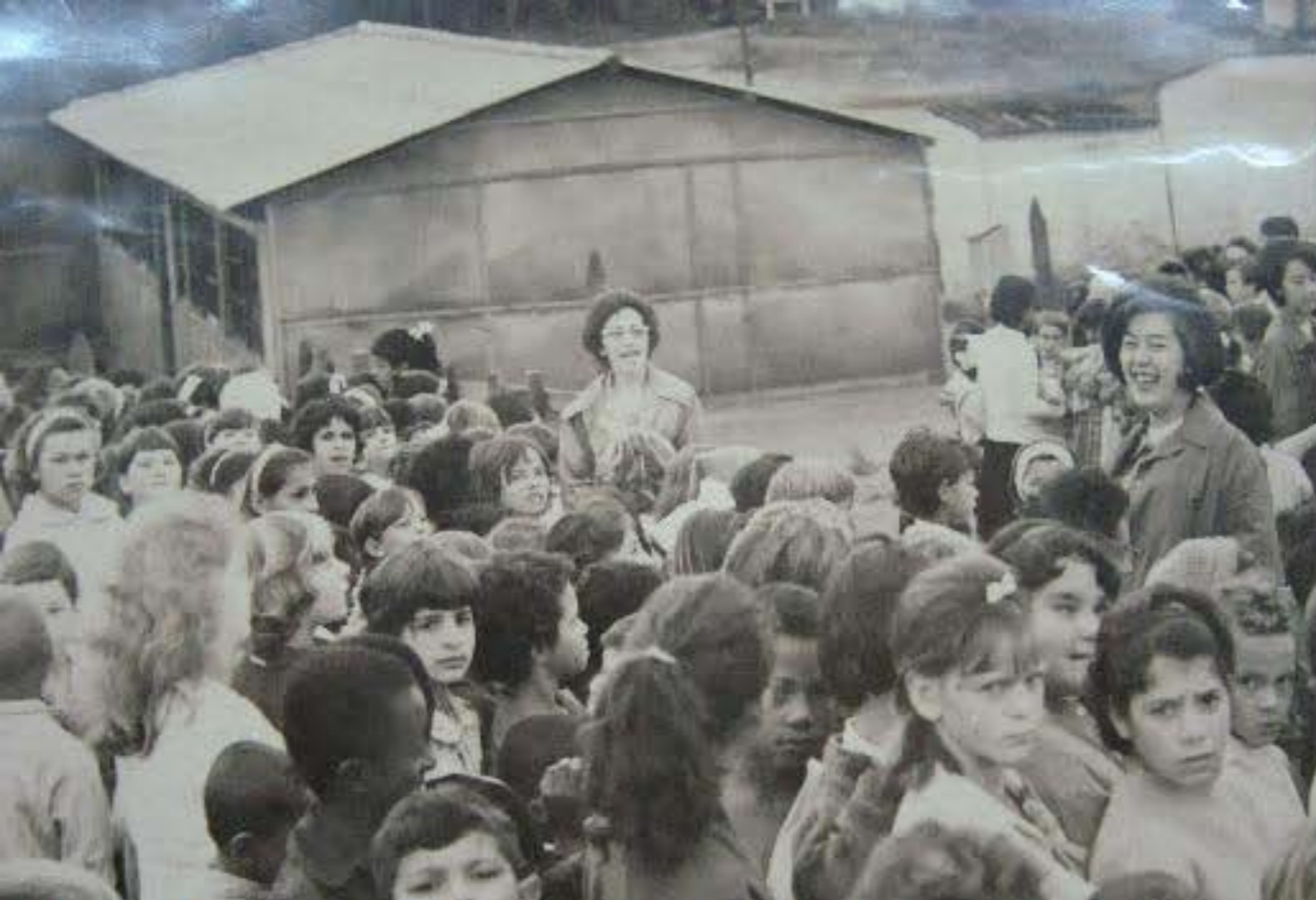
GRUPO ESCOLAR CAMPO LIMPO