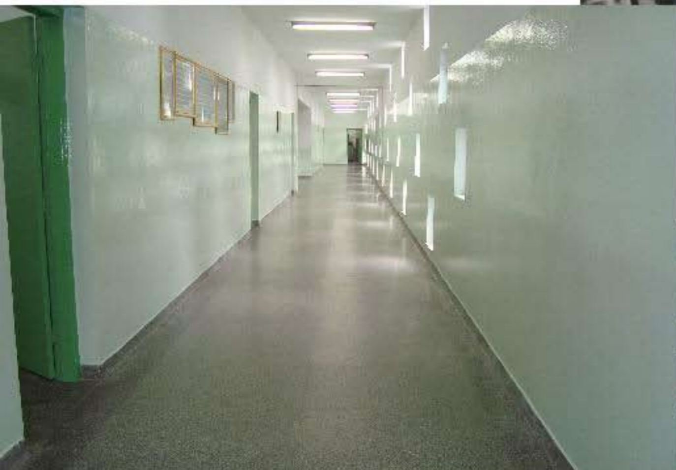
E. E. PRESIDENTE KENNEDY 2009